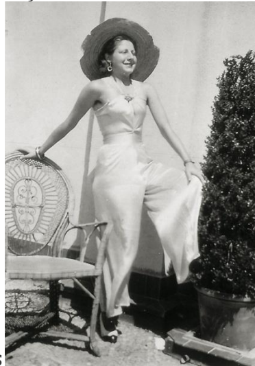
Gloria Fuertes a los 20 años

Escribo por las noches y voy al campo mucho. Todos los míos han muerto hace años y estoy más sola que yo misma. He publicado versos en todos los calendarios, escribo en un periódico de niños, y quiero comprarme a plazos una flor natural como las que le dan a Pemán algunas veces. (1953)