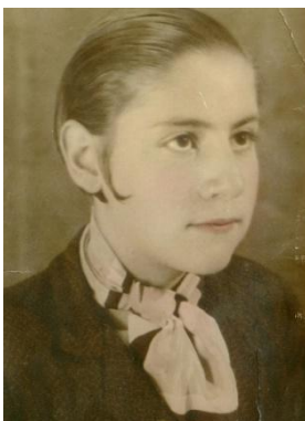
Gloria Fuertes a los 13 años

Gloria Fuertes nació en Madrid a los dos días de edad, pues fue muy laborioso el parto de mi madre que si se descuida muere por vivirme. A los tres años ya sabía leer y a los seis ya sabía mis labores. Yo era buena y delgada, alta y algo enferma. A los nueve años me pilló un carro y a los catorce me pilló la guerra; a los quince se murió mi madre, se fue cuando más falta me hacía.