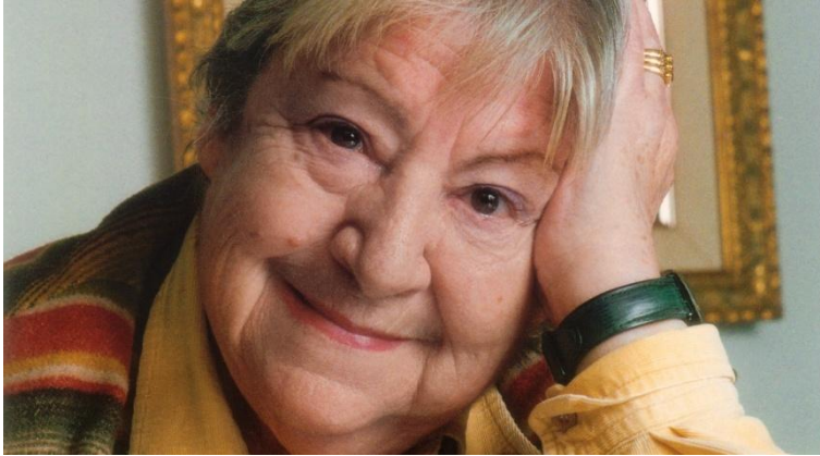
Gloria Fuertes (1917-1998)