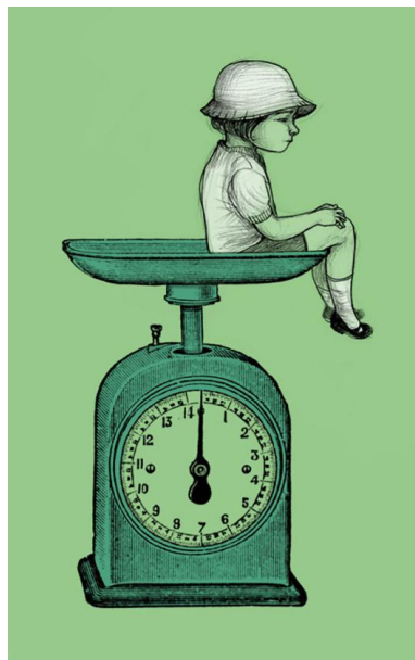
Ilustración de Noemí Villamuza

Tan solo obedece, el robot. A veces le envidio Sus ojos de vidrio Que nunca han llorado. Aunque no me entiende, Le cuento mis cosas, Me quedo a su lado. El robot no necesita compañía. Y cuando la Empresa Apaga sus luces, Me siento en su nave Hasta el nuevo día, Porque yo, sí necesito compañía.